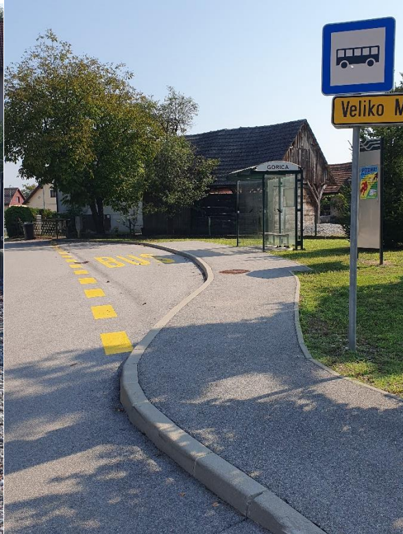
Zgledno urejeni postajališči na Jelšah in na Gorici.