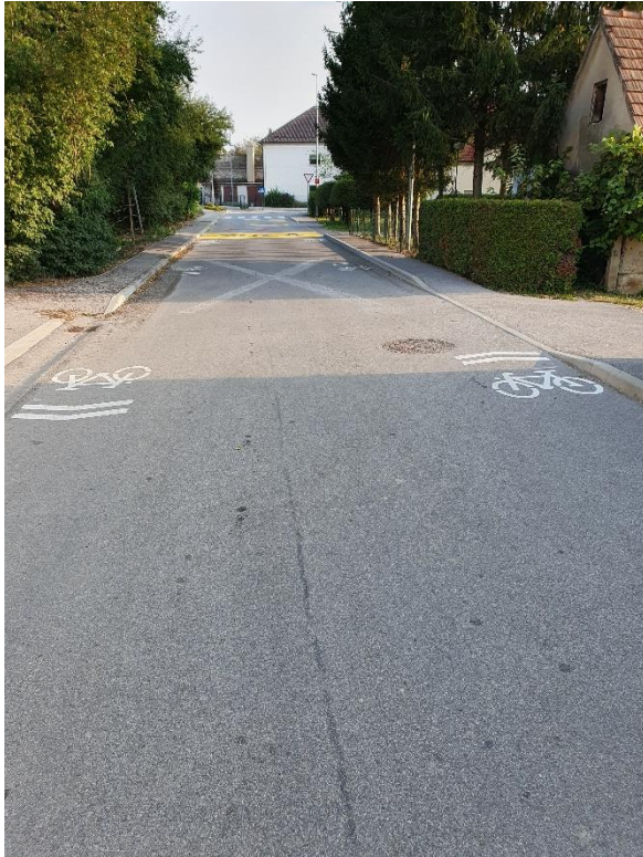
Slika 5: TALNE OZNAKE V OKOLICI DVORANE.

Avtobusna postajališča so urejena v nekaterih vaseh, pločniki, ki omogočajo varno hojo do postaje so v vaseh Veliki Podlog, Gorica, Jelše, Velika vas in Drnovo. Vasi Pristava, Mali Podlog in Gržeča vas pa prometno niso urejene. Na Pristavi in v Malem Podlogu ni nikakršne oznake za avtobusno postajališče. V Malem Podlogu avtobus ustavlja pri nekdanji mlekarni, ki je umeščena v ozko grlo nepreglednega ovinka. Učenci v smeri Velikega Podloga čakajo in vstopajo na avtobus na cesti, ki je tako ozka, da se niti dve vozili ne moreta srečati. Na Pristavi ustavlja sredi državne ceste, nasproti nekdanje gostilne. V obeh primerih učenci vstopajo in izstopajo ob cestišču brez urejenih pločnikov, brez kakršnihkoli oznak. V Gržeči vasi je le še blede vidna oznaka na cestišču, postajališča ni, cesta je ozka, pločnikov ni. Zgoraj navedene situacije so za učence nevarne.