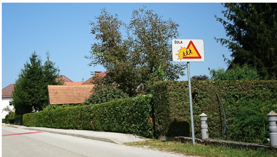
Slika 4: OZNAKE V OKOLICI ŠOLE.