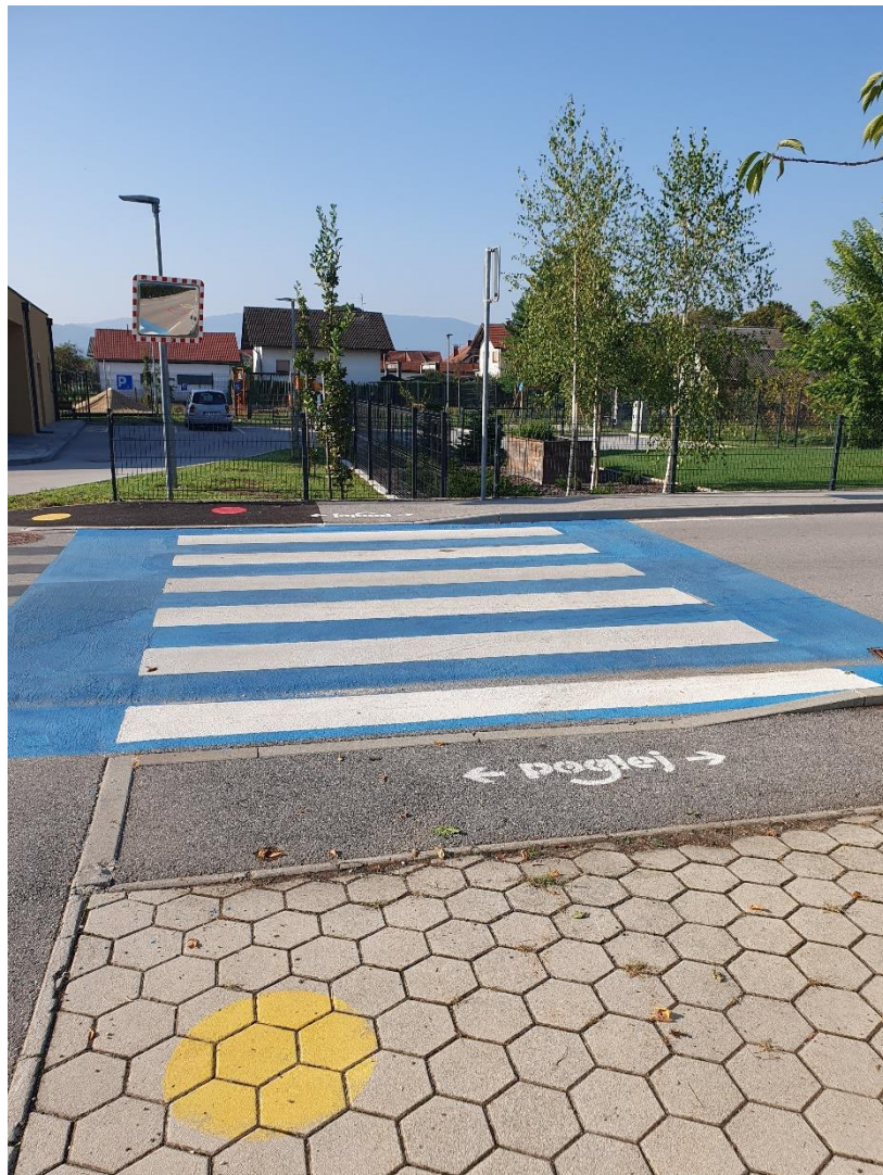
Prehod iz igrišča in parkirišča proti šoli. Zaradi lažjega vključevanja voznikov v promet je bilo dodano ogledalo.