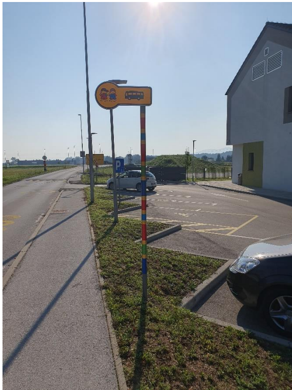
Avtobusna postaja na šolski strani.