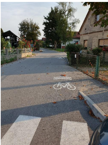
Oznaka kol. poti v vasi Veliki Podlog

V lanskem letu je bila zgrajena kolesarska steza, ki je del širše povezave med Kostanjevico in Krškim. V Veliki Podlog prihaja čez polje, v sami vasi je označena s talnimi oznakami. Pri priključitvi na državno cesto pa je se nadaljuje z dvosmerno kolesarsko stezo, ki je ločena od vozišča. Zgrajen je tudi prehod za kolesarje.