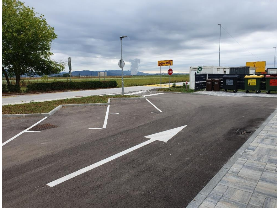
Parkirišče severna stran.