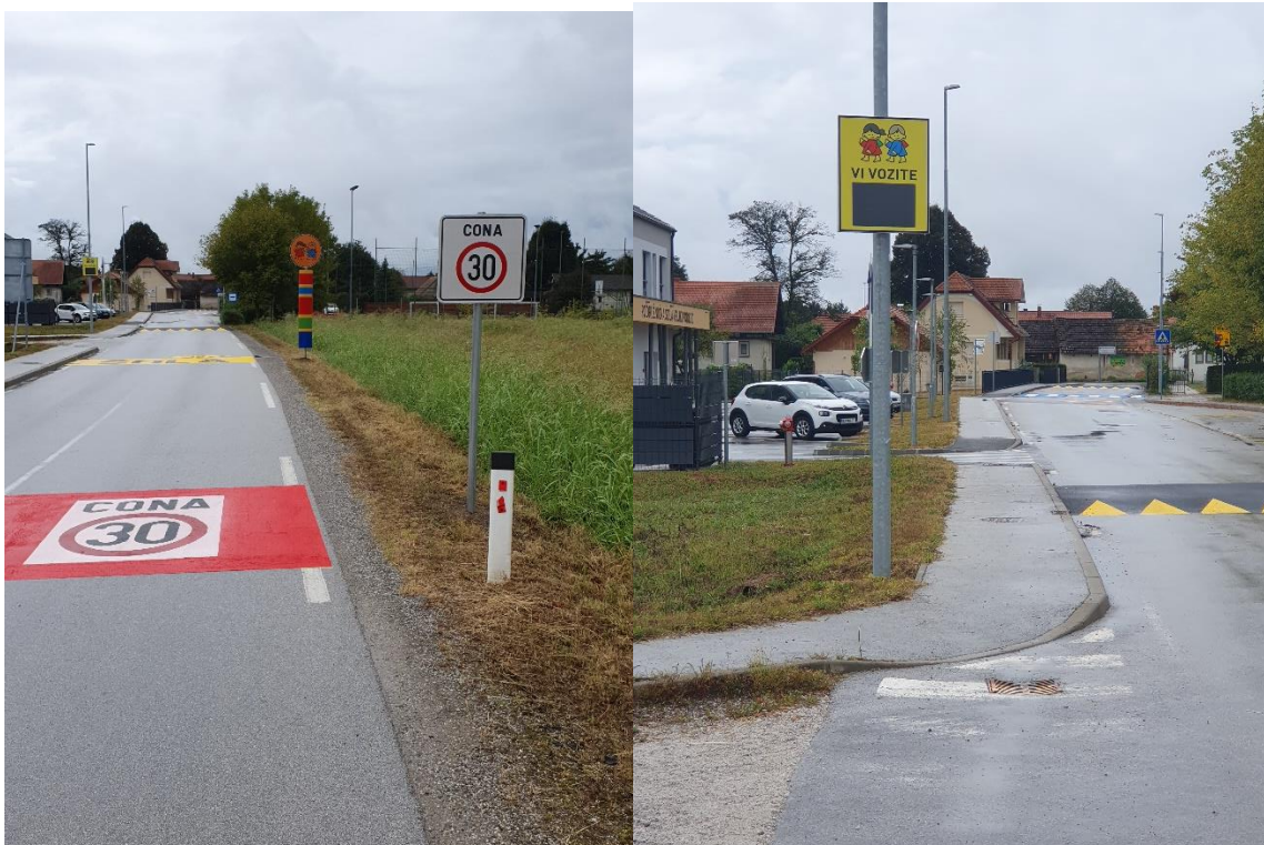
V okolici šole se je promet umiril tudi z uvedbo cone 30 in svetlobnim prikazovalnikom hitrosti.