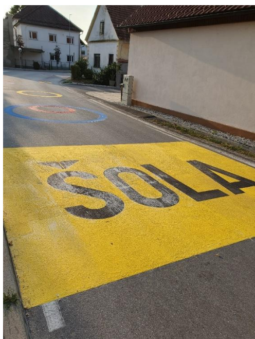
Slika 2 POGLED PROTI NEPREGLEDNEM KRIŽIŠČU PRI VODNJAKU.

Konec avgusta 2023 so bile v okolici šole dodatno zgrajene grbine, ki upočasnjujejo promet v coni omejitve 30 km/h, barvne talne oznake, barvasti stebrički in prikazovalnik hitrosti.