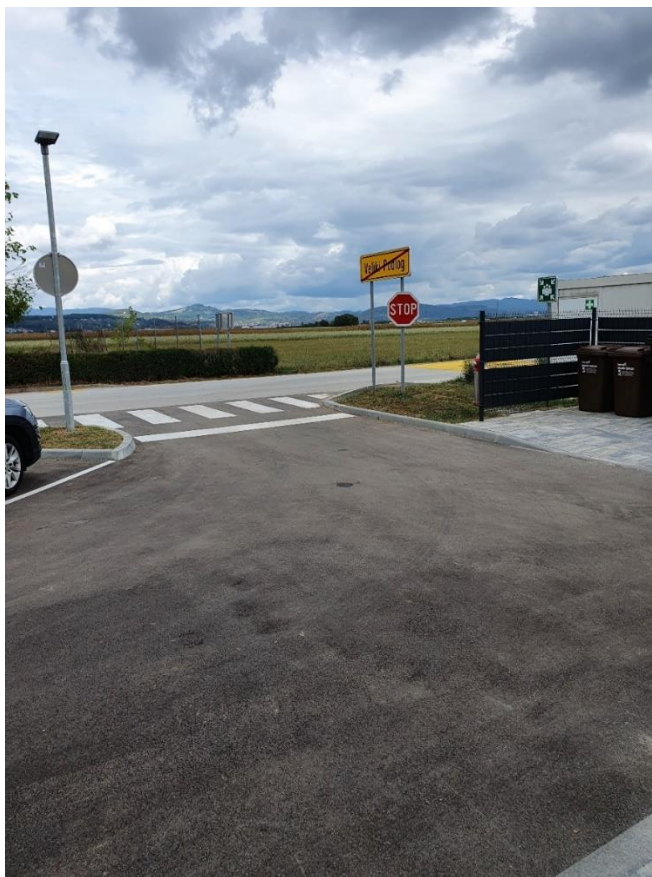
Urejenost s prometnimi znaki.