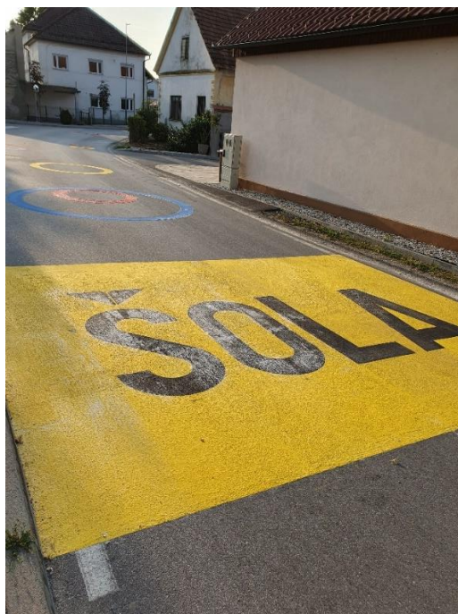
NEPREGLEDNO KRIŽIŠČE PRI VODNJAKU