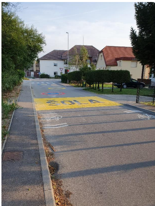
Slika 3: TALNE OZNAKE IN PLOČNIKI IZ SMERI DVORANE PROTI ŠOLI.

Novo talne oznake so bile narejene na vseh treh cestah, ki vodijo do šole: na glavni cesti, iz smeri večnamenske dvorane in v nepreglednem križišču pri stari šoli.