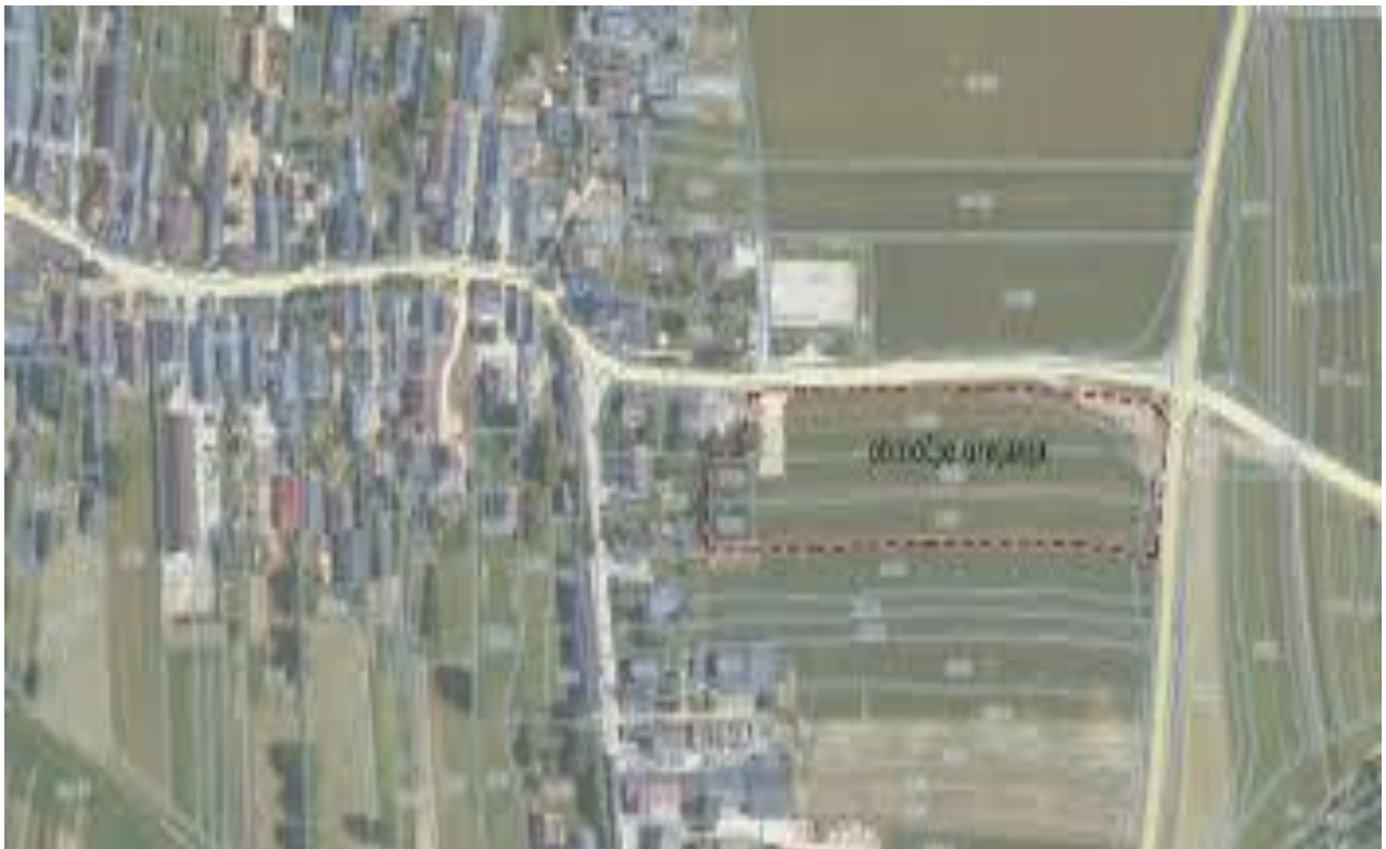
Slika1 in 2: Področje, kjer je umeščena nova OŠ