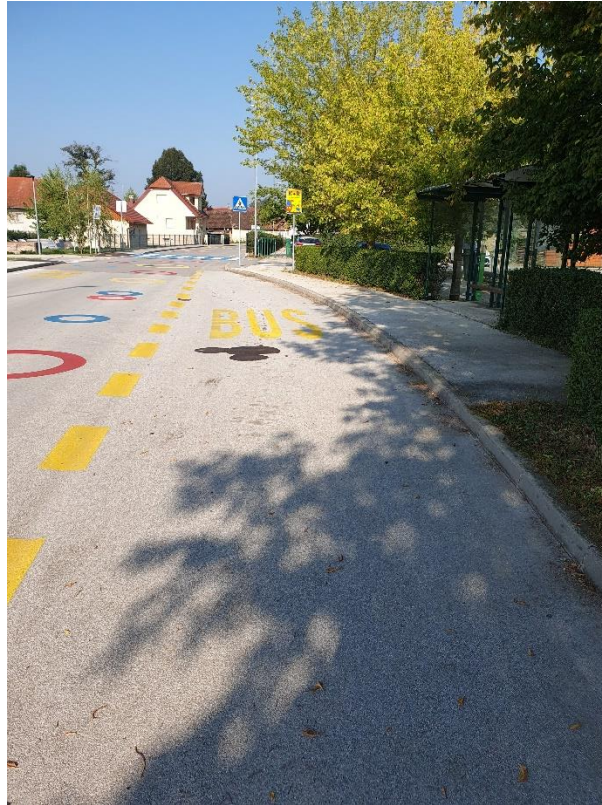
1AVTOBUSNA POSTAJA PRI IGRIŠČU