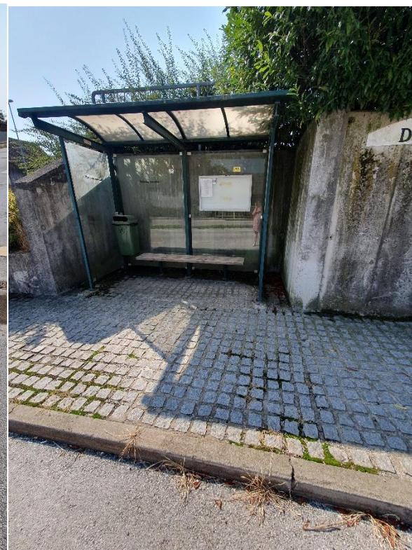
Na Drnovem je postajališče na obeh straneh ceste.