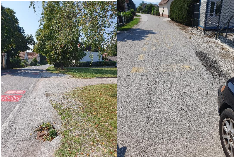
Pristava in Gržeča vas